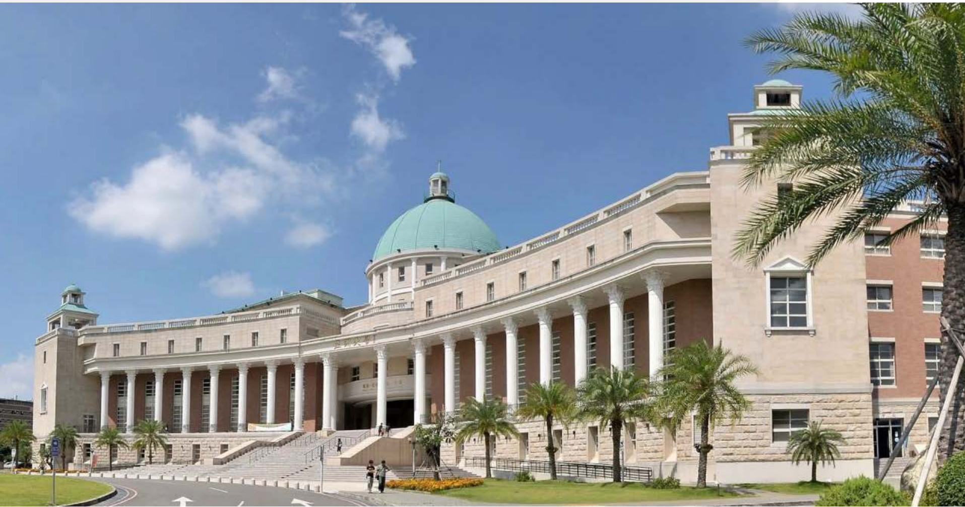
* Asia University Administration Building